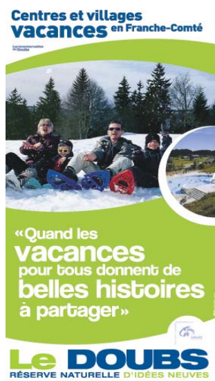
Support tissu - CDT 25